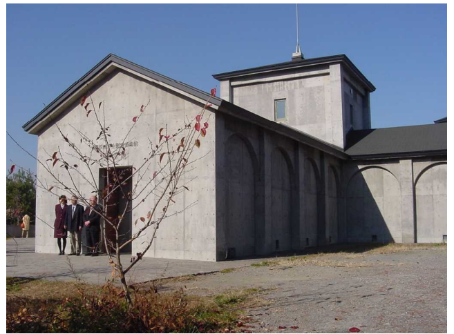
無言館(戦没画学生慰霊美術館)

安倍政権は、国会前に集まる多くの国民の声を無視し、いよいよ本格的に憲法改悪に着手し始めました。オキナワの負担軽減を逆手に取り辺野古新基地建設を強引に推し進め、横田基地や厚木基地にオスプレイが当たり前の様に飛来しています。その様な状況の中、松代見学会も、今年で19回目を迎えました。太平洋戦争末期の歴史的な事実を、自分の目で感じてみませんか? 下記の様な行程で実施を予定していますので、お誘い合わせの上、多数ご参加下さい。