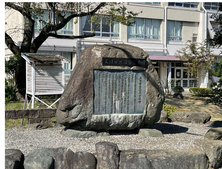
五日市憲法草案の碑

ロシアのウクライナ侵攻が進む中、 憲法改悪に向けての動きが活発になってきました。 「今の憲法では日本を守れない」 果たして、そうでしょうか。 東京教組では、もう一度みんなで平和について考え、 語り合う学習会を企画しました。 今回は、民間草案憲法の一つである「五日市憲法」にスポットを当て 五日市憲法にまつわる資料や名跡をめぐりながら 平和について、平和学習について、考えを深めたいと思います。 同僚やお友達など、お誘い合わせの上、是非ご参加ください。